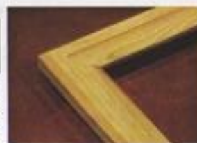
CADRE AVEC MOULURE Pin 32 X 23 mm Réf. 007-P