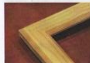
CADRE AVEC CHANFREIN Pin 32 X 23 mm Réf. 006-P