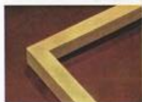
CADRE Hêtre 35 X 18 mm Réf. 013-H

Sur demande, les pointes flexibles peuvent être remplacées par des tournettes.