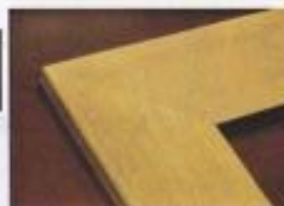
CADRE SAMBA DROIT 75 X 15 mm Réf. 009-S 50 X 15 mm Réf. 015-S 35 X 15 mm Réf. 014-S