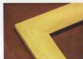
CADRE SAMBA ARRONDI 60 X 22 mm Réf.012-S 35 X 19 mm Réf. 011-S 20 X 17 mm Réf. 010-S