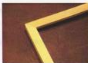
CADRE Hêtre 15 X 18 mm Réf. 001-H