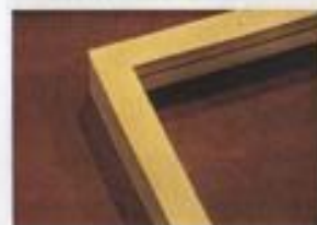
CADRE AVEC PARCLOSES Hêtre 30 X 20 mm Réf. 016-H